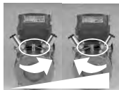
ELECTROBOMBAS CON BY-PASS

ATENCIÓN: antes de cualquier intervención, extraiga la clavija de la toma eléctrica. Las intervenciones que precisan una reparación de la parte eléctrica tiene que efectuarlas personal cualificado. No introduzca herramientas y ni siquiera los dedos de la mano en el interior de los portagoma de la bomba o entre las aletas del ventilador de enfriamiento porque podría sufrir lesiones graves.